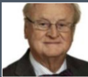
ARVID CARLSSON Nobelpristagare i fysiologi/medicin 2000.