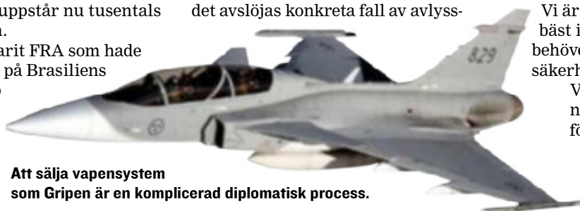
Att sälja vapensystem som Gripen är en komplicerad diplomatisk process.

Att sälja vapensystem, som Gripen är en komplicerad diplomatisk process, när det avslöjas konkreta fall av avlyss-