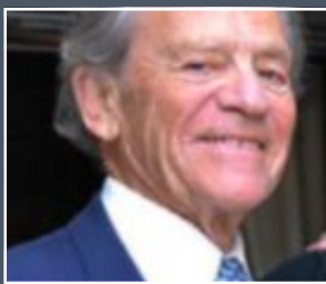
TORSTEN WIESEL Nobelpristagare i fysiologi/medicin 1981.