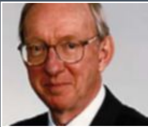
BENGT SAMUELSSON Nobelpristagare i fysiologi/medicin 1982.