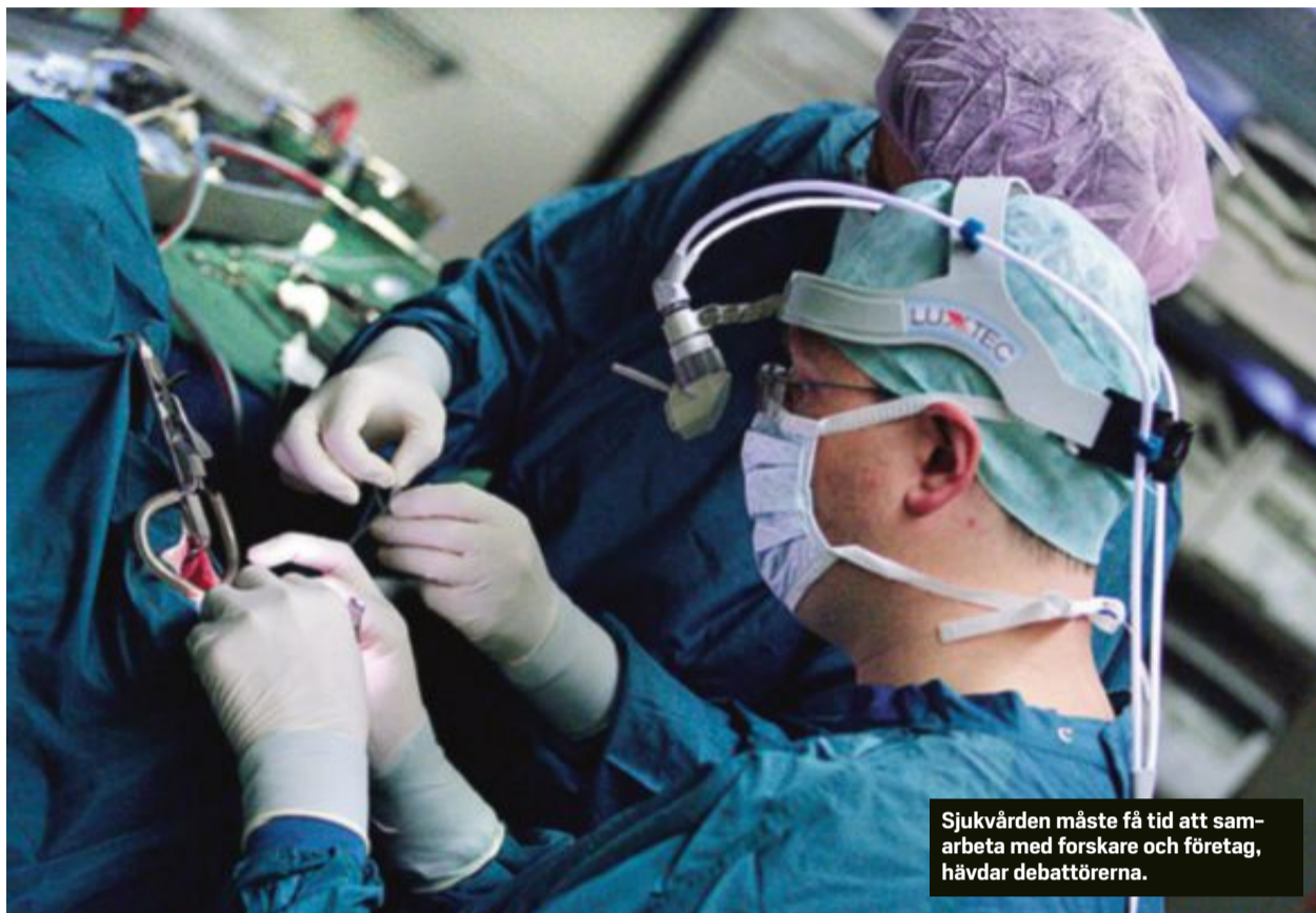
Sjukvården måste få tid att samarbeta med forskare och företag, hävdar debattörerna.