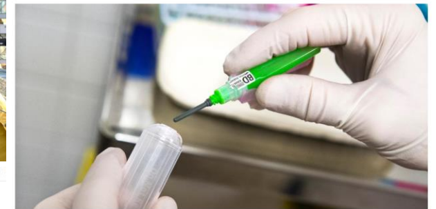
Samordnad hälsoodata är viktigt för svensk sjukvård enligt debattörerna. Arkivbild.